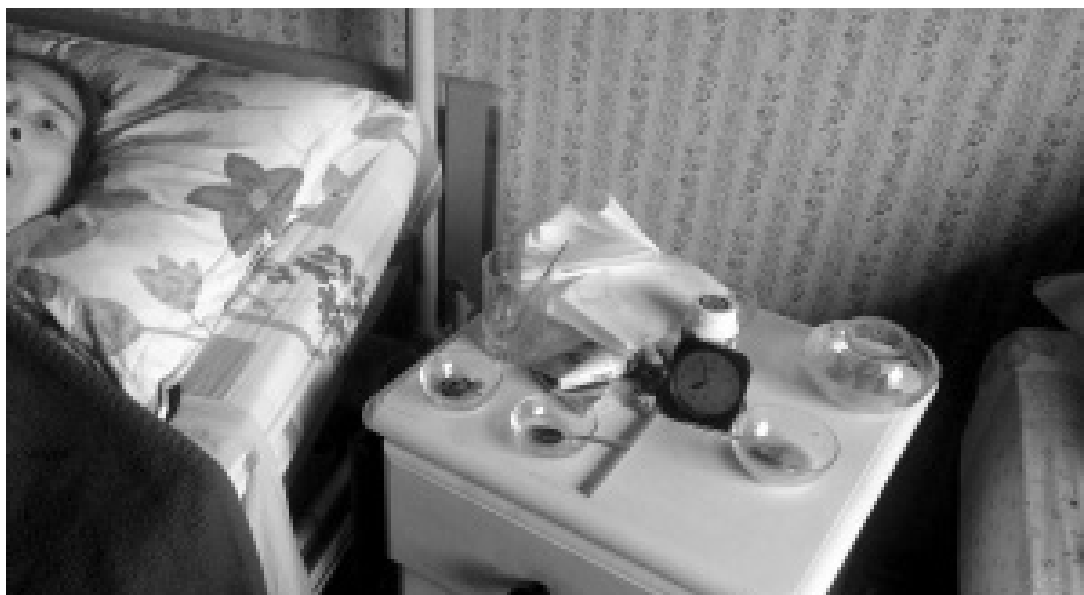
Vinneren av LOFF-prisen