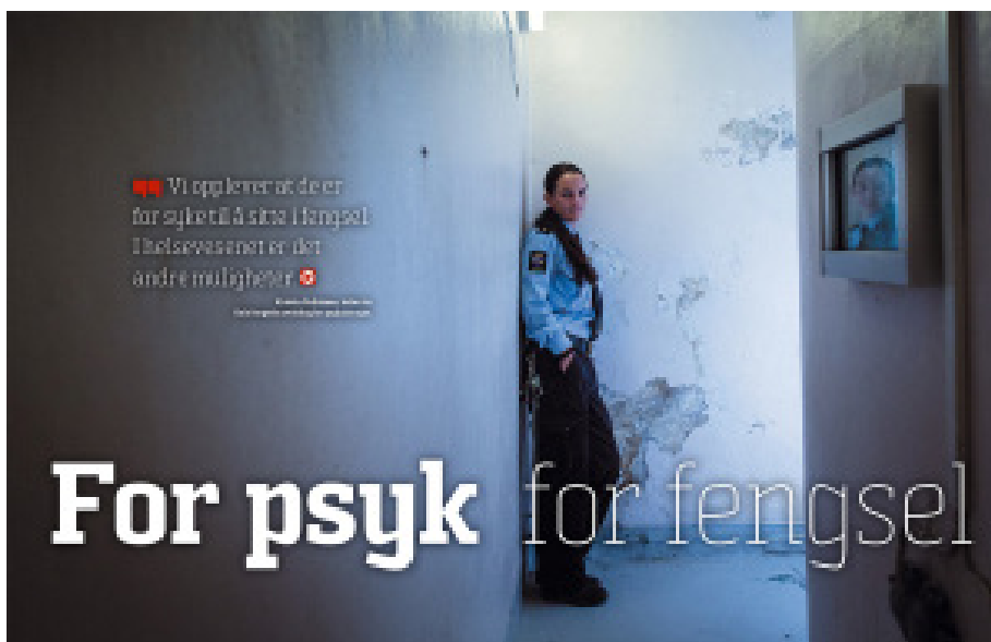
Vinneren i klassen for journalistikk